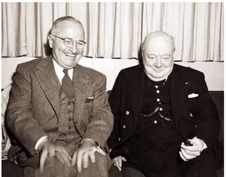
Der britische Premierminister Winston Churchill (rechts) brachte US-Präsident Harry S Truman (links) auf Konfrontationskurs gegen Rußland und leitete so den Kalten Krieg ein.

„Das übergeordnete oder politische Ziel besteht darin, Rußland den Willen der Vereinigten Staaten und des Britischen Empire aufzuzwingen.“ Dazu sollten Atomwaffen noch 1945 oder so bald wie möglich danach gegen die Sowjetunion eingesetzt werden. Wie wir an anderer Stelle in diesem Weißbuch berichten, ist das gleiche auch heute, im Jahr 2025, die Absicht der britischen Finanz- und Geheimdienstmächte - die ein und dasselbe sind - gegenüber Rußland und China, um in dem Großen Spiel, wie es die Briten seit Jahrhunderten nennen, den „Endsieg“ zu erringen.