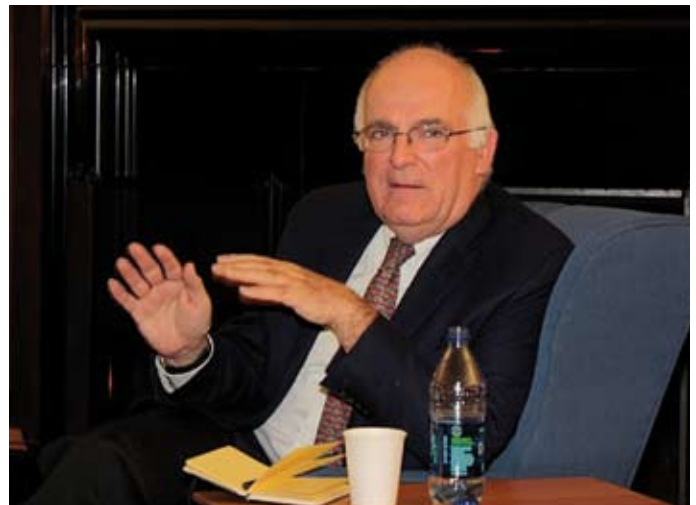
und Sir Richard Dearlove, ehemaliger Direktor des britischen Auslandsgeheimdienstes MI6 (1999-2004).

mist , The Guardian und die Financial Times gehörten zu den Medien, die täglich die erfundenen Narrative verbreiteten. Ein extremes Beispiel für die Feindschaft der britischen Presse gegen Trump war die Titelgeschichte des Spectator vom 31. Dezember 2017: „Wird Donald Trump ermordet, durch einen Putsch gestürzt oder einfach nur angeklagt werden?“