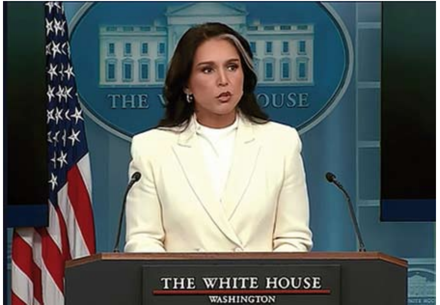
Die Direktorin der Nationalen Geheimdienste der USA, Tulsi Gabbard, bei der Vorstellung der freigegebenen Dokumente. (White House, via Youtube, cc)

Am 18. Juli veröffentlichte die Direktorin der Nationalen Nachrichtendienste der USA (DNI), Tulsi Gabbard, eine Reihe von Dokumenten 1 mit Bezug auf das falsche Narrativ, Rußland habe sich zugunsten von Donald Trump in die Präsidentschaftswahlen 2016 eingemischt und damit zur Niederlage der Kandidatin der Demokratischen Partei, Hillary Clinton, beigetragen. Gabbard erklärte dazu: „Die Informationen, die wir heute veröffentlichen, belegen eindeutig, daß es 2016 eine verräterische Verschwörung gab, an der hochrangige Beamte unserer Regierung beteiligt waren. Ihr Ziel war es, den Willen des amerikanischen Volkes zu untergraben und einen jahrelangen Staatsstreich zu inszenieren, um den Präsidenten daran zu hindern, das ihm vom amerikanischen Volk übertragene Mandat zu erfüllen.“ 2