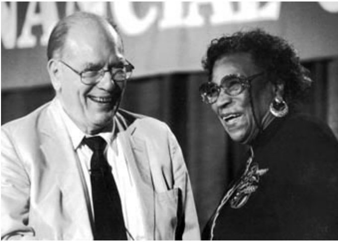
Lyndon LaRouche und die Bürgerrechts-Heldin Amelia Boynton Robinson bei einer Konferenz des 1984 von Helga Zepp-LaRouche gegründeten Schiller-Instituts. Robinson war Gründungsmitglied und bis 2009 dessen Vizepräsidentin.