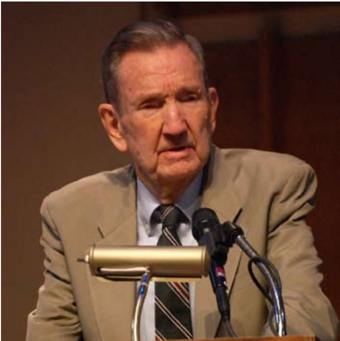
Ramsey Clark, ehem. Justizminister der Vereinigten Staaten, bei einer Veranstaltung zur Feier des 30jährigen Bestehens des Schiller-Instituts.