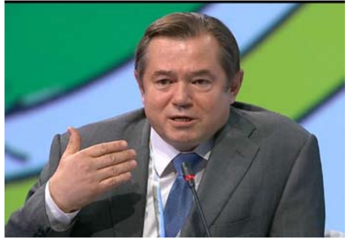
Sergej Glasjew, Mitglied der Russischen Akademie der Wissenschaften, Berater des Präsidenten der Russischen Föderation, Moskau, Rußland

Das von LaRouche herausgegebene Magazin EIR war ein Leitfaden durch die dunklen Korridore der westlichen herrschenden Elite, worin die verborgenen Quellen der menschenfeindlichen Politik der Weltfinanzoligarchie aufgedeckt wurden. Er verfolgte deren Ursprünge bis zur Zeit der Plünderung des Byzantinischen