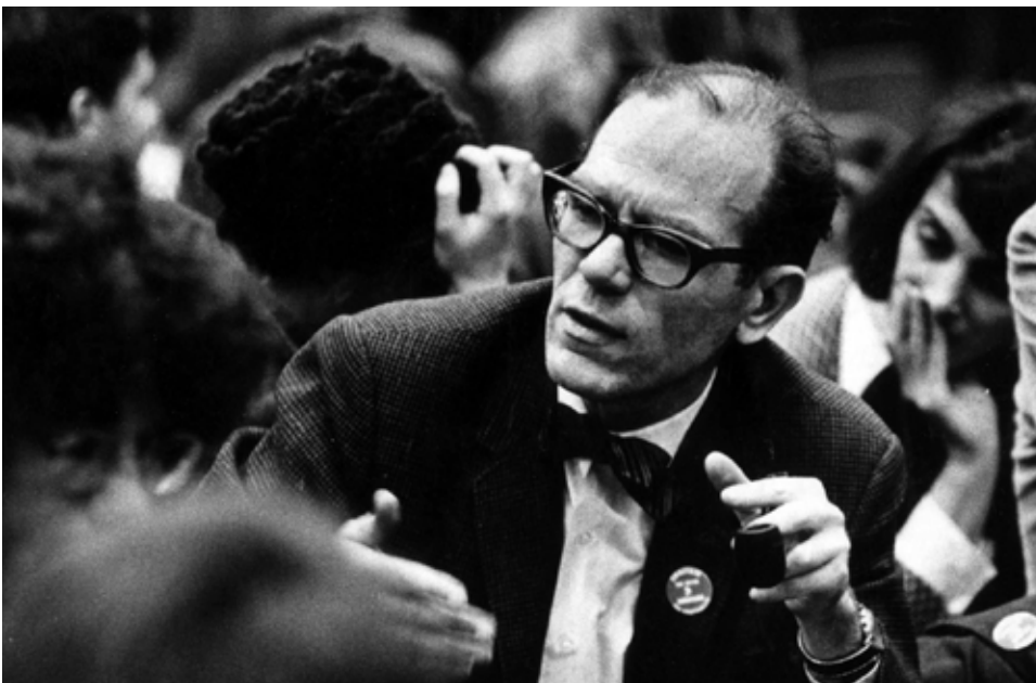
Lyndon LaRouche 1973 im Gespräch mit Studenten in New York City. Er verband ein einzigartiges Verständnis des Zusammenhangs zwischen technischem und wirtschaftlichem Fortschritt, das durch seine Lektüre von Bernhard Riemann geprägt war, mit einer kompromißlosen Moral im Kampf für die wirtschaftliche und kulturelle Entwicklung, die notwendig ist, damit alle Menschen ihr größtes menschliches Potential erreichen können.

Mein Ehemann hat ein enormes Gesamtwerk hinterlassen, in dem seine begeisternden Visionen für die nächsten 50 Jahre der Menschheit und darüber hinaus ebenso zum Ausdruck kommen wie seine bahnbrechenden wissenschaftlichen, künstlerischen und philosophischen Konzeptionen. Die Veröffentlichung soll so schnell wie möglich erfolgen. Aber er wirkte und wirkt nicht nur durch seine Schriften, denen er mit dem Furor des Genius bis ins hohe Alter oftmals 60-80 Seiten pro Tag, druckreif und mit allen Fußnoten versehen, hinzufügte. Einen unmeßbaren und enormen Effekt hatte er nicht nur in öffentlichen Reden, sondern vor allem im persönlichen Gespräch, wobei oft schon ein einziges genügte, um das Leben des Gesprächspartners für immer zu berühren. Zahlreiche Beiträge zu den Festschriften für die „runden“ Geburtstage während der letzten 30 Jahre und in jüngster Zeit eine Flut von Kondolenzschreiben anlässlich seines Ablebens spiegeln den tiefen Effekt wider, den er auf viele Menschen auf der ganzen Welt hatte.