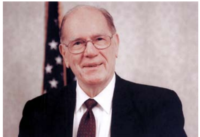
Lyndon LaRouche im Jahr 2003, während seines achten Präsidentschaftswahlkampfes.

Prominente internationale Persönlichkeiten und Institutionen haben zwar jüngst über LaRouche zu berichten begonnen, doch hat es keines der „großen Medien“ bisher gewagt, LaRouches wirkliche Ansichten über politische Fragen, für die er bekannt war, zu zitieren, obgleich er einer der produktivsten Autoren Amerikas gewesen ist. Diese Angst vor LaRouche ist erstaunlich, aber nicht neu. Es war schon immer so, daß die Macht von LaRouches Ideen, genauso wie oder noch mehr als die Person LaRouche von seinen Gegnern zutiefst gefürchtet wurde. Diese Furcht wird mit seinem Tod nicht nachlassen.