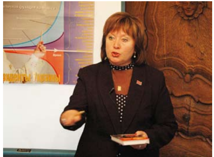
Natalja Witrenko, Doktor der Wirtschaftswissenschaften, Vorsitzende der Progressiven Sozialistischen Partei der Ukraine, Abgeordnete in der zweiten und dritten Legislaturperiode des Obersten Rada. Im Hintergrund ein Wahlplakat, in dem sie vor Lyndon LaRouches „typischer Kollapsfunktion“ zu sehen ist.

Und alles ohne Erfolg! Die Bibel sagt uns weise, man solle keine Perlen vor die Säue werfen. Zu dieser Zeit lag alles