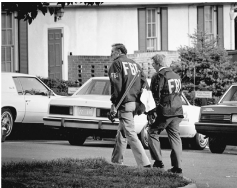
Am 6. Oktober 1986 überfielen 400 bewaffnete FBI-Agenten und andere Strafverfolgungsbeamte in gepanzerten Autos und Hubschraubern die Büros und Wohnungen von Lyndon LaRouche und seinen Mitarbeitern in Leesburg, VA, und setzten Schockmethoden ein, um eine gewalttätige Konfrontation zu provozieren.